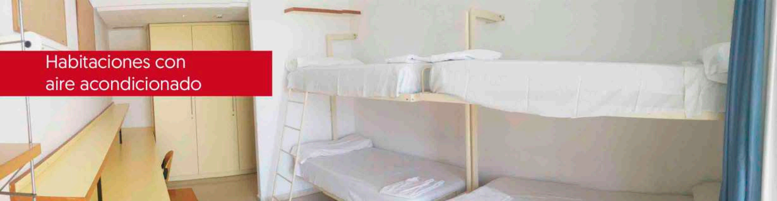
Habitaciones con aire acondicionado