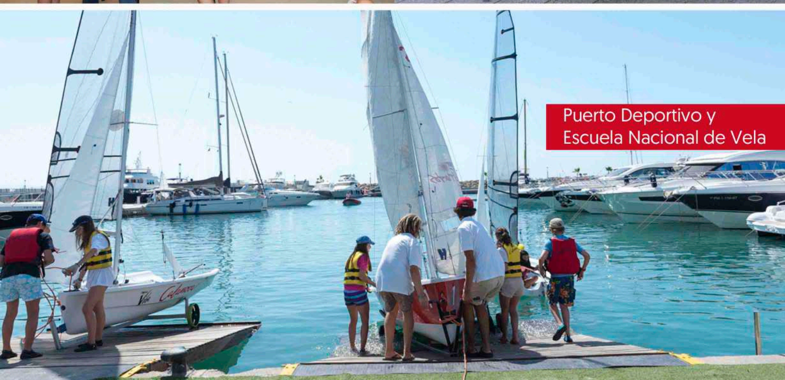
Puerto Deportivo y Escuela Nacional de Vela